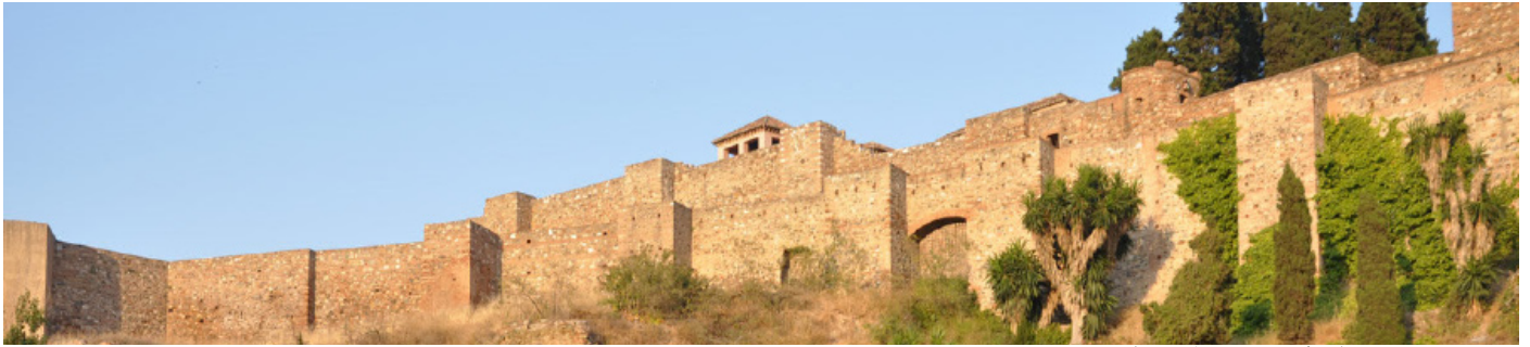
摩爾城堡—阿卡薩巴堡 Alcazaba

八世紀，隨著摩爾人征服西班牙，馬拉加變成了重要的貿易中心。一位著名的旅客把馬拉加形容為“安達魯西亞最大、最美麗的城鎮之一。而且馬拉加讓大海和大陸團結起來。” 馬拉加的清真寺又大又美麗，而花園裡種了非常高的柳橙樹。