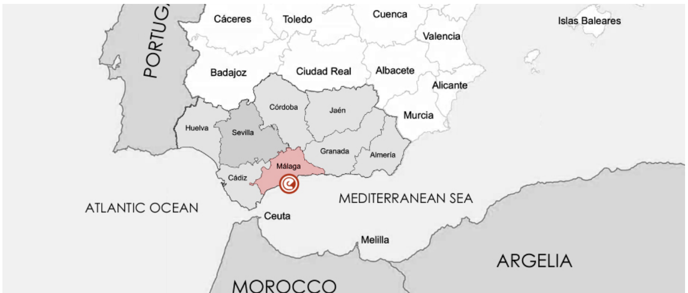
馬拉加的地理位置

馬拉加擁有歐洲最溫暖的冬天之一。12月到2月，白天的平均氣溫為 17^{\circ}\text{C} ，而晚上為 7-8^{\circ}\text{C} 。夏季季節約有八個月，從4月到11月。雖然如此，其他四個月的氣溫有時都高達 20^{\circ}\text{C} 。