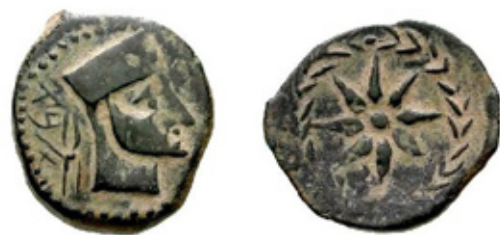
腓尼基人在馬拉加使用的硬幣

後來，羅馬帝國征服了Malaka。在這個時段，Malaka這個城市經歷了巨大的發展。他們也在這時建了一個羅馬劇場。