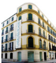
馬拉加主教座堂、 羅馬劇場、 馬拉加燈塔和畢卡索的出生地